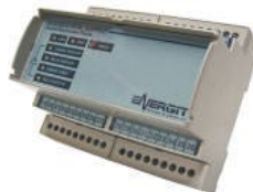
EMA, EMCM, EMCT